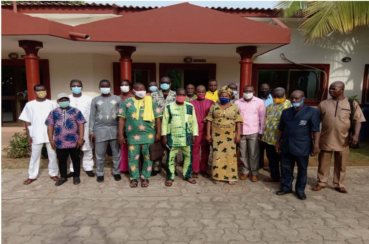
Photo de famille lors de l'atelier de mise en place du Groupe Consultatif Volaille (GCV)