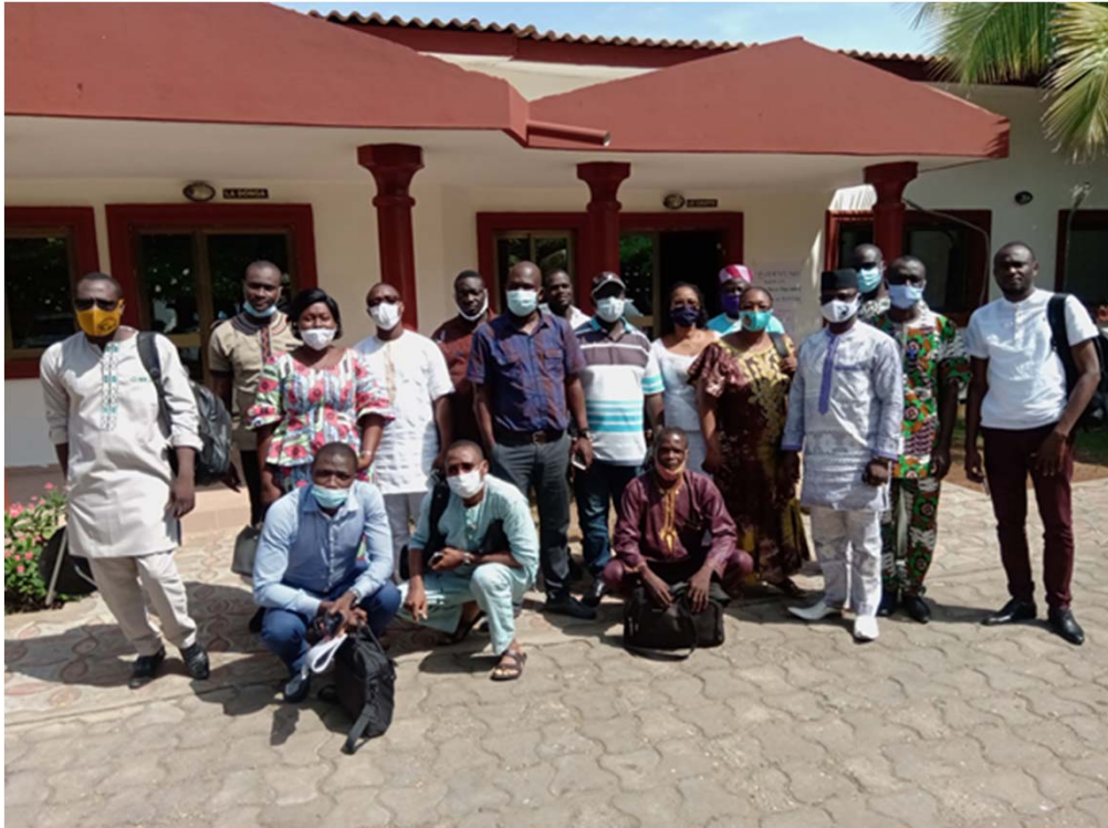
Photo de famille lors de l'atelier de mise en place du Groupe Consultatif Soja (GCS)